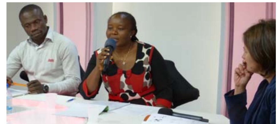
Lors de la conférence du 17 septembre, à l'espace Ouest-France , Pré-Botté.

Que ce partenariat et l'amitié entre La Voix et l'association continuent de prospérer. »