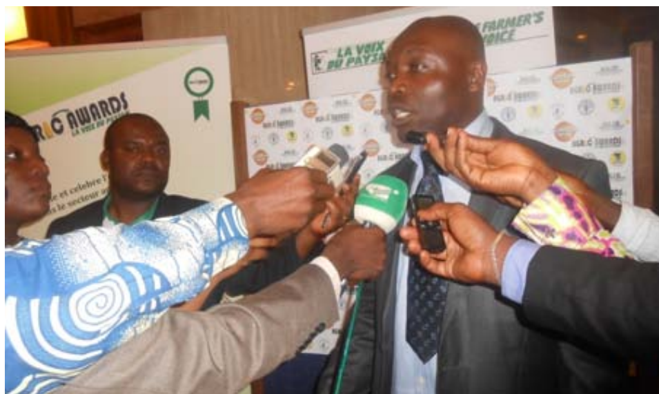
La seconde édition des Agric Awards aura lieu le 18 novembre. Une occasion de mobiliser les médias sur les initiatives du monde rural.